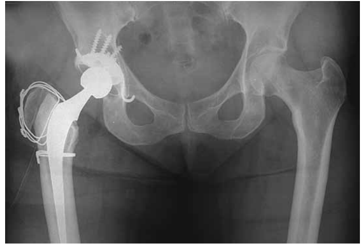
Röntgenbild eines Hüftgelenks nach dem Prothesenwechsel.

Wie verläuft der Spitalaufenthalt? Der Spitalaufenthalt unterscheidet sich nicht wesentlich von jenem der Erstoperation. Weil bei der Wechseloperation meist der Rollhügel gelöst und wieder fixiert werden muss, dauert die Heilung 8 bis 12 Wochen. In dieser Zeit darf das Gelenk maximal mit 15 kg teilbelastet und höchstens um 70 Grad abgewinkelt werden. Um dies zu gewährleisten, sind ein Keilkissen zum Sitzen und ein WC-Aufsatz notwendig. Wenn Sie diese Einschränkungen einhalten, mit zwei Stöcken gehen können und die Wunden trocken sind, können Sie aus dem Spital entlassen werden. Die Instruktion über die Mobilisation erfolgt in der Physiotherapie.