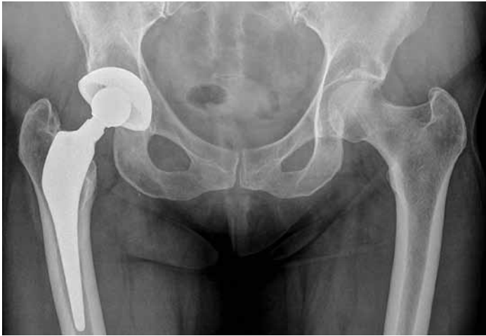
Röntgenbild eines Hüftgelenks vor dem Prothesenwechsel.