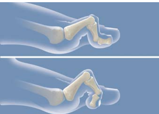
Abb. 1 Hammerzehe (oben), Krallenzehe (unten)