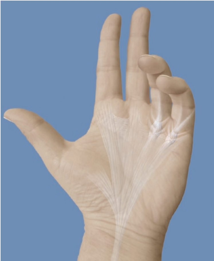
Die Hautverankerungsbänder am 4. und 5. Finger haben sich knotig verdickt und verkürzt, zu trichterförmigen Hauteinziehungen geführt und die Finger in eine Beugestellung gezogen.

Nachbehandlung. Für ein möglichst gutes Resultat und um einen Rückfall zu verhindern, ist eine konsequente Nachbehandlung wichtig. Diese umfasst Narbenbehandlung, Therapie und das Tragen einer Schiene zur Streckung der Finger während 6 Wochen. Ferner empfehlen wir das Tragen einer Nachtschiene während 6 Monaten.