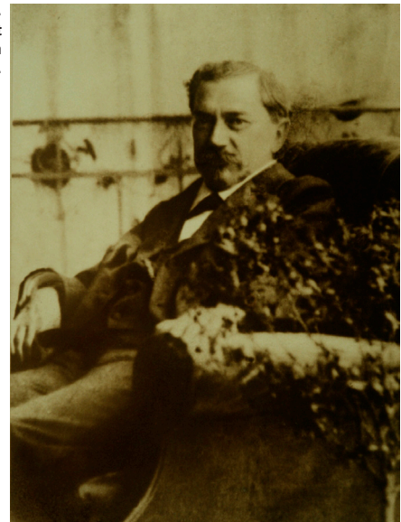
Wilhelm Schulthess (1855–1917). Gründer der Anstalt Balgrist und Erforscher der Skoliose von internationalem Ruf.