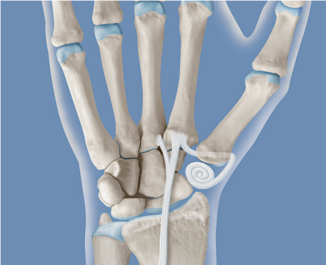
Zustand nach Ersatz des grossen Vieleckbeines durch eine aufgerollte Hälfte der Handgelenkssehne. Zur Stabilisation wurde diese durch den Daumen-Mittelhandknochen hindurchgeführt.

servativen Behandlungsversuche/Möglichkeiten ausgeschöpft, müssen operative Therapien diskutiert werden. Auch hier gibt es verschiedene Behandlungsmöglichkeiten. Das am häufigsten verwendete Verfahren ist die Trapezektomie mit Interpositionsarthroplastik mit der Hälfte einer Handgelenkssehne. Bei dieser Operation wird das grosse Vieleckbein entfernt und durch einen aufgerollten Sehnenstreifen ersetzt. Neben dieser Methode gibt es noch die Möglichkeiten, das zerstörte Gelenk durch eine Gelenkprothese zu ersetzen oder das Sattelgelenk zu versteifen (Arthrodesse). Eine operative Behandlung wird kurzstationär, meistens mit einer Regionalanästhesie des betroffenen Arms, durchgeführt.