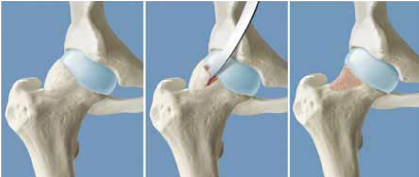
Abb. 1A bis 1C: Mit einem Meissel werden nicht-sphärische Kopfanteile getrimmt.

operierte Bein vorerst lediglich mit ca. 15 kg belasten. Die Operationswunde ist mit einer durchsichtigen, atmenden Folie abgedeckt. Die Folie bleibt, bis die Wundheilung abgeschlossen ist. Duschen ist ohne besondere Vorkehrungen möglich. Sobald Sie Ihre Selbstständigkeit (an zwei Stöcken gehen, aus dem Bett aufstehen, Treppen steigern etc.) wieder erlangt haben und durch den Physiotherapeut am Hometrainer instruiert wurden, dürfen Sie das Spital verlassen.