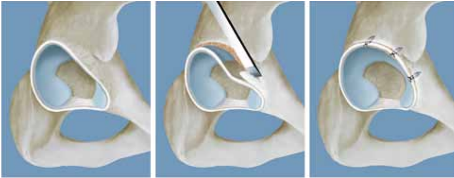
Abb. 2A bis 2C: Trimmung von vorstehenden Pfannenrandanteilen mit einem Meissel und Refixation der Gelenksslippe mit Knochenanker.