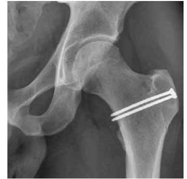
Abb. 3: Röntgenbild eines Hüftgelenks nach der Pfannenrandtrimmung und Retailierung am Kopf-Schenkelhalsübergang.

ständig 3 Mal pro Tag während 15 Minuten auf dem Hometrainer. Sie sollten das operierte Bein weiterhin mit ca. 15 kg belasten. Je nach beruflicher Tätigkeit und Arbeitsweg können Sie Ihre Arbeit in Teilzeit wieder aufnehmen.