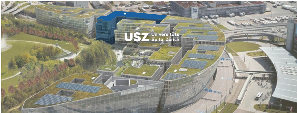
Der Standort USZ Flughafen im Quartier «Circle»